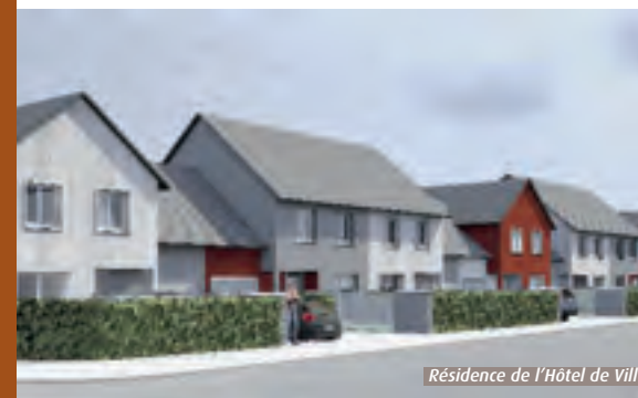
Résidence de l'Hôtel de Ville