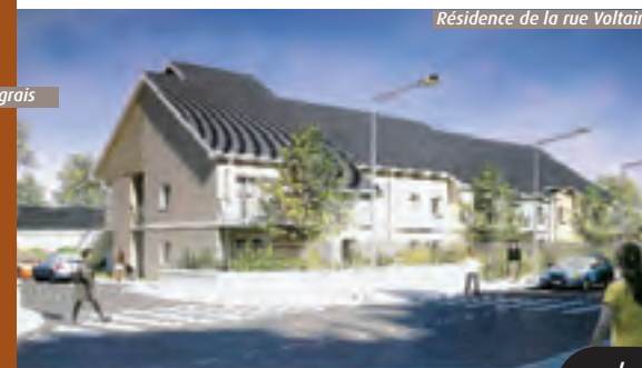
Résidence de la rue Voltaire