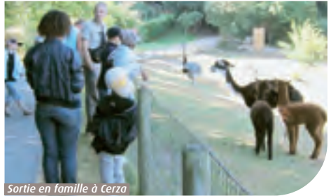
Sortie en famille à Cerza

Cette association assure une distribution de denrées alimentaires aux familles saint-aubinoises remplissant certains critères. Des bénéficiaires et des bénévoles participent à la préparation et à la distribution des colis. Pour bénéficier de cette aide alimentaire, il faut s'adresser au C.C.A.S. de Saint-Aubin-lès-Elbeuf au 02 35 81 96 66.