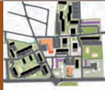
Opération de renouvellement urbain - Quartier des Feugrais

Plus d'informations sur : www.ville-saint-aubin-les-elbeuf.fr