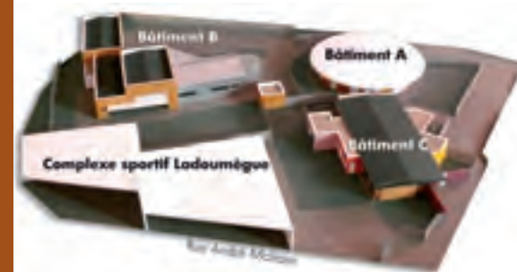
Centre Social Secondaire