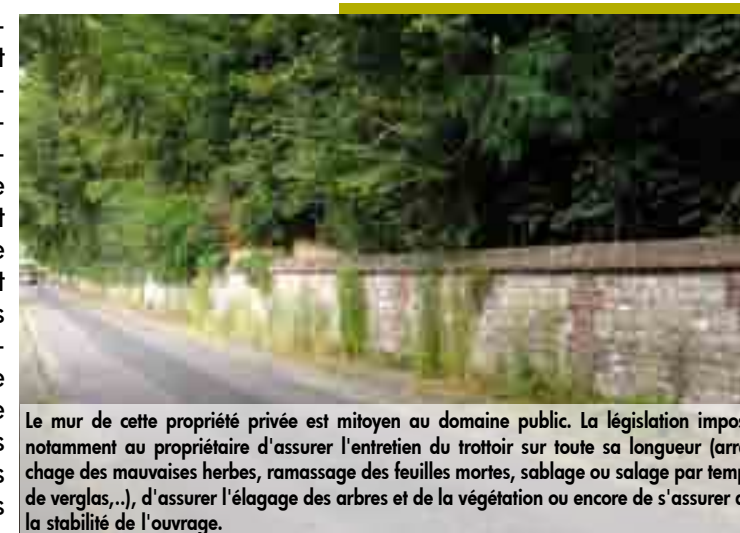
Le mur de cette propriété privée est mitoyen au domaine public. La législation impose notamment au propriétaire d'assurer l'entretien du trottoir sur toute sa longueur (arrachage des mauvaises herbes, ramassage des feuilles mortes, sablage ou salage par temps de verglas...), d'assurer l'élagage des arbres et de la végétation ou encore de s'assurer de la stabilité de l'ouvrage.

Ainsi, les propriétaires riverains ou occupants doivent maintenir le trottoir en bon état de propreté sur toute la largeur de la propriété. Il leur incombe par conséquent d'enlever les herbes situées sur le trottoir, de procéder au ramassage des feuilles mortes, de procéder à l'élagage des haies, arbres, et autres plantations dépassant sur la voie publique, de dégager un passage permettant le croisement de deux piétons lors de chutes de neige et, par temps de verglas, de s'assurer que le revêtement n'est pas glissant (le cas échéant, de mettre du sel ou du sable pour faciliter le passage des piétons). Les saletés déplacées ne doivent pas être mises dans le caniveau mais ramassées et traitées comme les autres déchets.