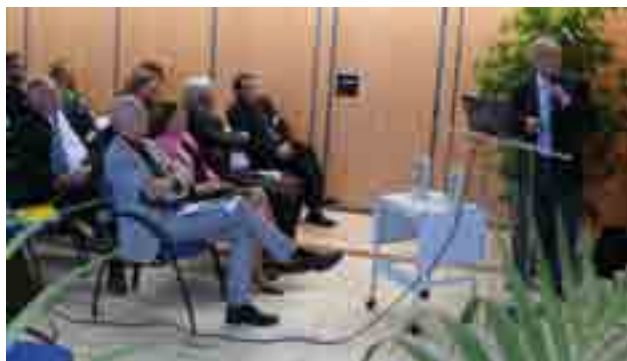
A l'affût de technologies innovantes pouvant amener des économies, la ville de Saint-Aubin accueillait cette année le congrès de l'organisation Cimbeton qui réunissait 70 techniciens normands.

Cette technique, encore sous utilisée, a pour but de conserver les matériaux excavés pour les réutiliser sur place. Concrètement, un rouleau déstructure le corps de chaussée, un broyeur intégré concasse les matériaux pour en faire des granulats. Les liants hydrauliques y sont alors mélangés pour régénérer le matériau d'enrobé qui est ensuite redéposé sur la