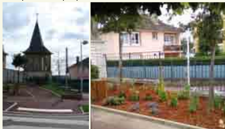
L'espace herbeux à proximité du rond point des rues de Freneuse et Jean Jaurès a été remplacé par des vivaces bordées de paillage, un massif plus économique en entretien.

Les produits phytosanitaires représentent un important risque pour la santé humaine et l'environnement (encart 1) d'où le renforcement de la réglementation. L'arrêté dit "fossé" de janvier 2012 (encart 2) a étendu l'interdiction de l'utilisation des produits phytosanitaires à proximité des points d'eau. Cet arrêté a donc conduit les communes à adopter des modes de traitements alternatifs, en ayant recours à des méthodes traditionnelles ou des solutions préventives telles que le paillage, le balayage des caniveaux, les plantations et l'engagement adapté au lieu d'implantation, ... Des solutions qui, il faut en être conscient, n'ont rien d'aussi radical et efficace qu'un traitement chimique.