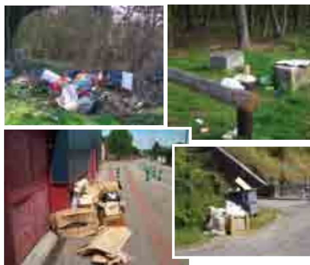
Zones urbaines ou naturelles, les dépôts de déchets sauvages se multiplient.

Depuis les trois dernières années, le contexte de maîtrise des dépenses budgétaires et d'augmentation raisonnée des impôts prélevés par la commune ont conduit à une forte réduction des sommes allouées à l'entretien des espaces verts publics qui représentent, rappelons-le, 80 hectares. Si le service municipal des espaces verts, composé de 12 agents, a longtemps bénéficié de l'appui d'entreprises extérieures, les interventions de ces dernières ont été réduites de 75% en 3 ans, dégageant quelque 100 000 euros d'économie. Parallèlement, les incivilités ne cessent d'augmenter : dépôt de débris sur la voie publique, déjections canines jonchant les trottoirs, bords de Seine parsemés des restes de feux de camps et débris divers, dépôts d'encombrants en pleine nature, manque d'entretien des espaces privés... Difficile dans ce contexte d'être partout à la fois.