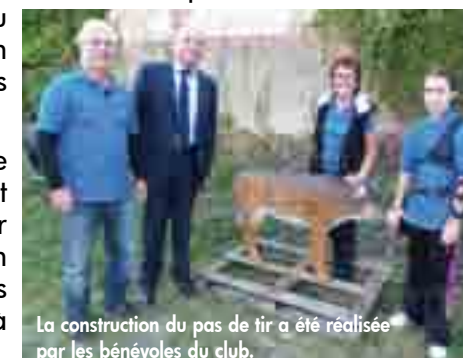
La construction du pas de tir a été réalisée par les bénévoles du club.

Seul pas de tir animalier de l'agglomération, l'équipement propose 8 cibles dont 5 en "tir 3D" (animaux) et 3 cibles en "tir nature" (blasons), placées à des distances allant de 10 à 30 mètres.