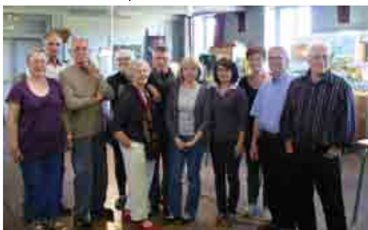
Les 25 peintres membres du collectif se retrouvent le lundi après-midi dans cet atelier très lumineux. Au cours de ces séances libres, chacun travaille sa technique d'après photo, portrait, nature morte ou selon son imagination.

Le collectif d'artistes "Les Hauts du Couvent" (nom venant de leur atelier, situé sous les toits de la Congrégation du Sacré Cœur) ouvrait les portes de son atelier fin septembre. Près de 80 visiteurs ont pu apprécier tout au long du week-end la centaine de toiles présentées, fruit du travail d'une quinzaine d'artistes exposants.