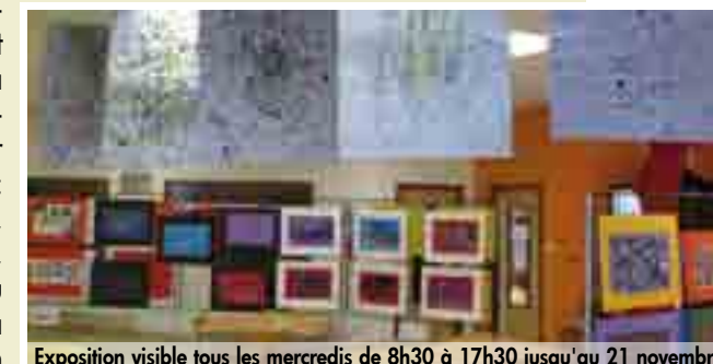
Exposition visible tous les mercredis de 8h30 à 17h30 jusqu'au 21 novembre

Parmi les activités proposées par la Ville, l'atelier "Arts plastiques" attire chaque année une douzaine d'enfants. Cet atelier est animé par Isabelle Zéo, artiste rouennaise diplômée de l'école d'art de Cergy Pontoise. Au cours de ces séances, les enfants abordent de façon ludique les différentes techniques de peinture, l'harmonie des couleurs, le travail à partir de différentes matières. Les réalisations des enfants ayant participé à cet atelier en 2011-2012 sont actuellement exposées à l'accueil de loisirs l'Escapade. On peut y découvrir de nombreuses créations : des peintures surréalistes, des pastels, des collages, des "paintings", ou encore, des œuvres "à la manière de..." (Jackson Pollock notamment).