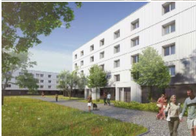
Les Fleurs : illustration du rendu final des façades issue du permis réalisé par le maître d'œuvre Cabinet ARA.