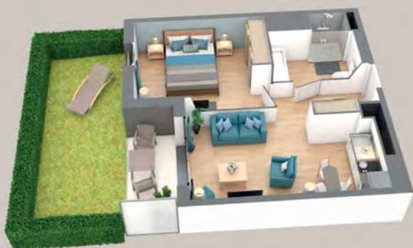
Exemple de disposition pour un appartement 2 pièces